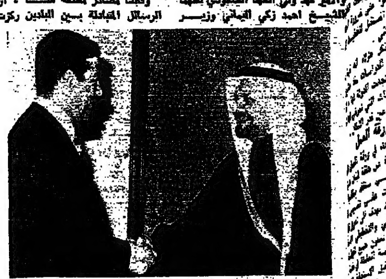
السيد صدام حسين لدى استقباله امس في بغداد

بغداد - من غزالي الميالي: بدأت بغداد والرياض المشاورات التي جرت بين الملك خالد والوزير امس في بغداد. وكانت مصادر مطلقة هنا، ان الرسائل المتبادلة بين البلدين ركزت